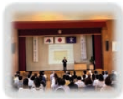
青少年健全育成大会