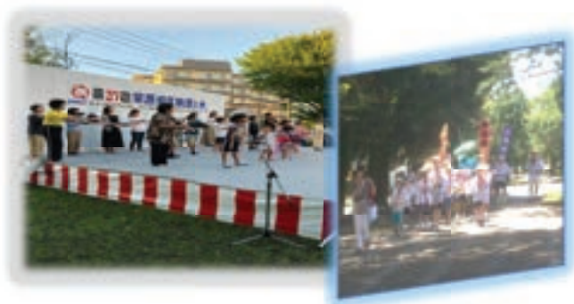
校区納涼大会・子どもみこしパレード