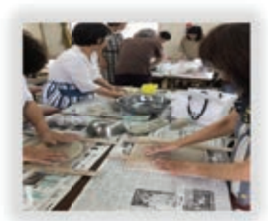
女性学級(陶芸研修)