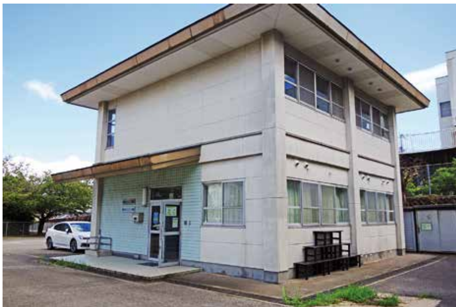
武岡台校区公民館・事務局