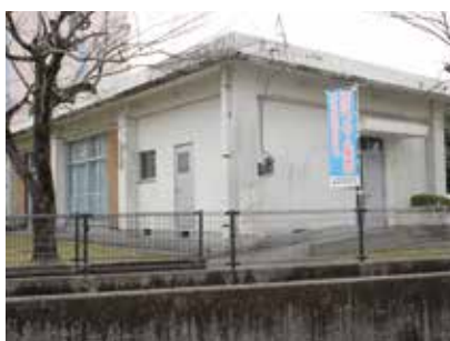
市住さつき 町内会集会所