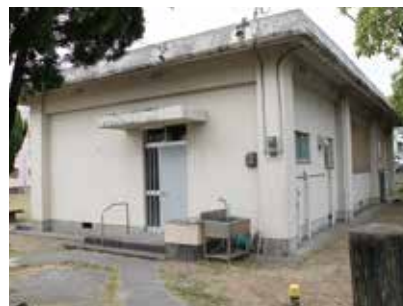
市住若駒 町内会集会所