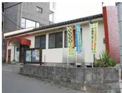
武岡第二ハイランド 町内会公民館