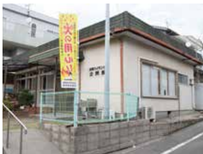
武岡ハイランド 町内会公民館