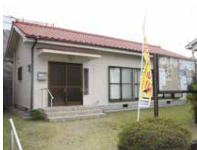
武岡ハイランド第三 町内会公民館