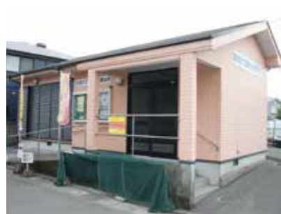
武岡六丁目 町内会集会所