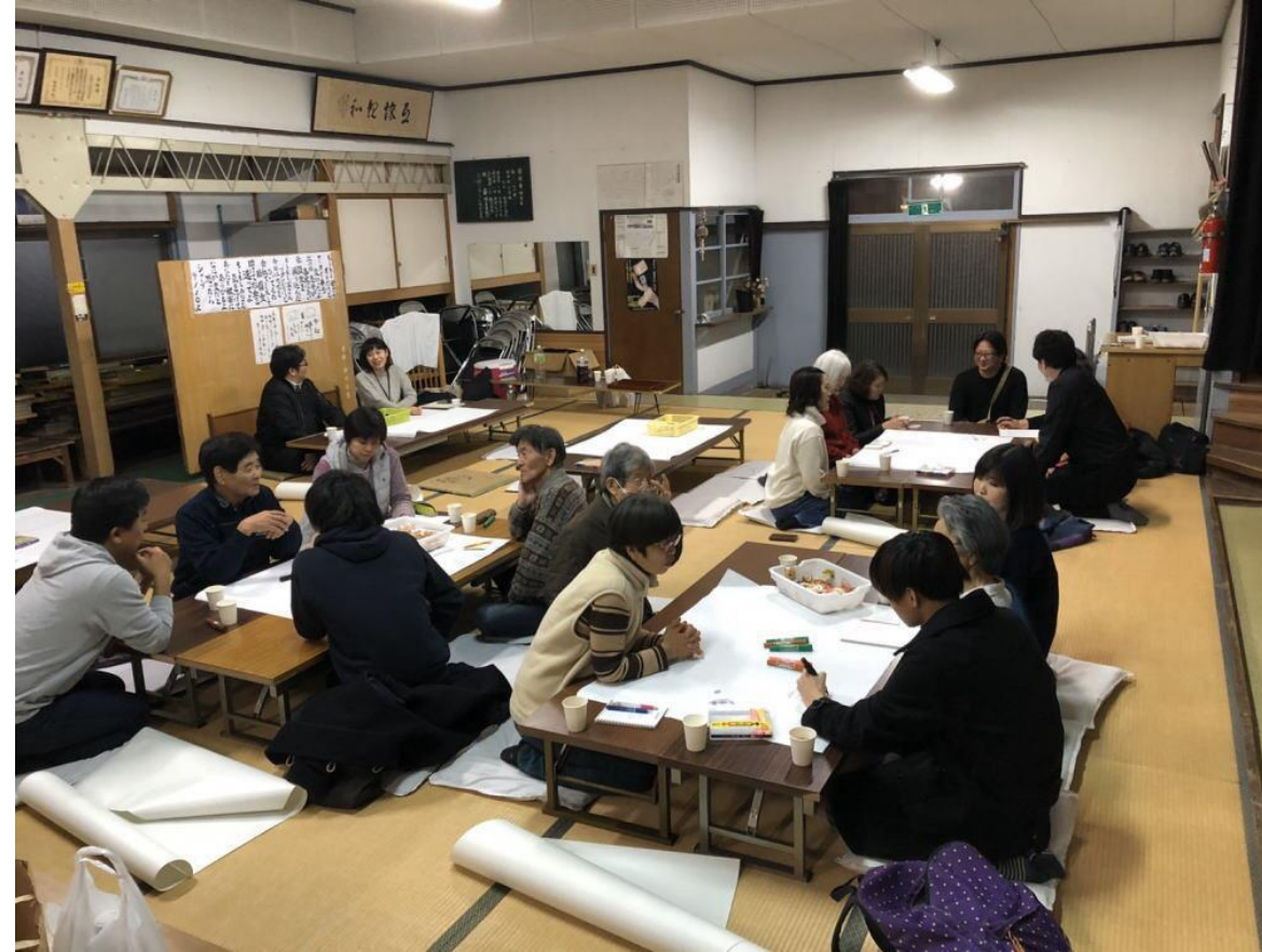
町内会と大学生で実施したワークショップ