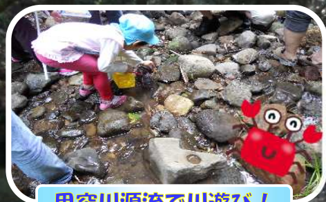
甲突川源流で川遊び！