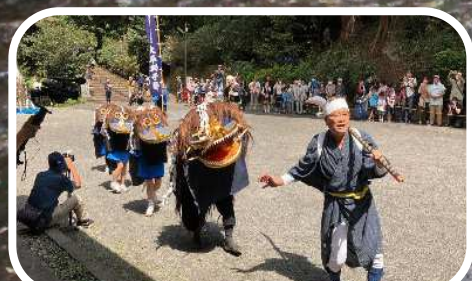
郷土芸能体験（大平の獅子舞）