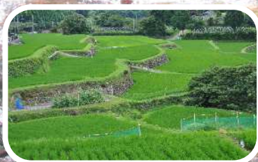
花尾神社・甲突池・八重の棚田の史跡体験イベント！