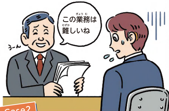
Case2 しよく ば さ べつ てき たい ぐう 職場における差別的待遇 しょうがい じん たい しょう 障害があることを理由に昇進の対象としないなど

ほか ぶつ り てき せい ど てき み せい び ぎやくたい しゃ かい さん か せい げん その他にも、物理的・制度的バリアフリーの未整備や虐待、社会参加の制限など しょうがい じん たい しょう 障害のある人の人権問題は数多く存在します。