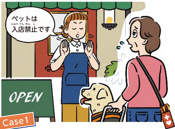
Case1 しょうがい り かい ぶ そく へんけん さ べつ 障害への理解不足による偏見・差別 せい とう り ゆう てい きやう きよ ひ 正当な理由なくサービスの提供を拒否するなど