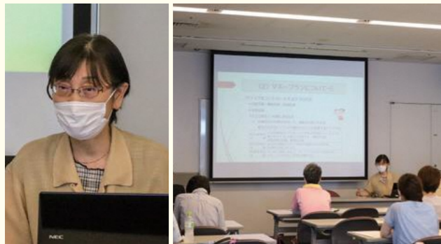
▲家族や友人にも話づらいお金の悩み。参加者からの質問も多く、有意義な時間となりました

家計簿が続かない、投資ってなんだか怖い、そもそも何から始めたらいいかわからないという方に向けて、自身の体験談も交えながらお金の基本からふやし方・つくり方・まもり方まで具体例とともにわかりやすくレクチャー。税制などを活用しながら将来に備える方法を学びました。