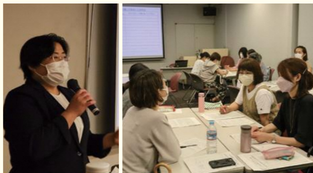
▲アサーティブなコミュニケーションについて学び、グループワークを通して生活にどう生かすか考えました

グループワークを通して自分自身の考え方や捉え方のクセ、自分と相手の捉え方・考え方の違いを確認し、自分の気持ちを率直に伝えられるスキル・スムーズなコミュニケーションスキルを磨きました。