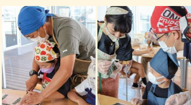
▲クジラの飾り巻き寿司と、かきたま汁を父子で力を合わせてつくりました

管理栄養士の講師ゆかりさんを講師に迎え、小学生と父親の6組が飾り巻き寿司とかきたま汁づくりにチャレンジ。細かいパーツをいくつも作り、組み上げていく作業に悪戦苦闘しながら完成した飾り巻き寿司の美味しさはひとしおだったよう。参加者からは「夏休みの良い思い出ができた」、「子どもの成長を感じた」、「さっそく家で作ってみたい」などの感想が寄せられました。家族みんなで家事をすることの大切さを学び、父子の絆を深めることができました。