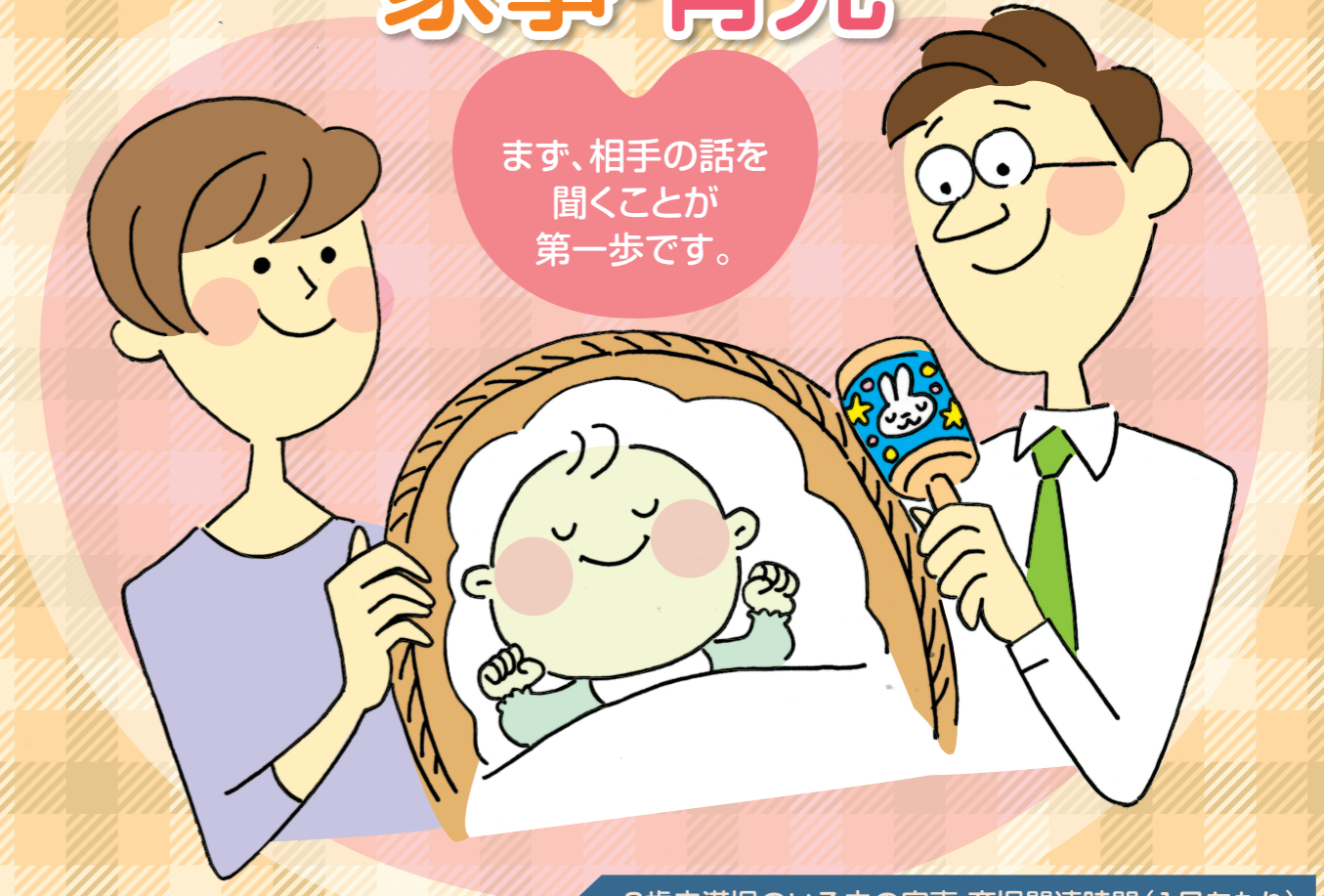
6歳未満児のいる夫の家事・育児関連時間(1日あたり)