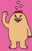
マグマシティPRキャラクター マグニョン