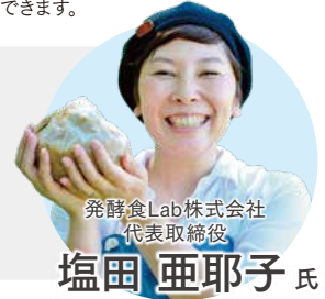
発酵食Lab株式会社 代表取締役

2013年、約13年間社会人生活を送った東京を離れ、鹿児島県薩摩川内市上甕に移住。地域おこし協力隊として、島内の農業者、漁業者、加工業者、小売店、飲食店とタッグを組み、ブランディングや商品開発、販路開拓を行う。3年間の協力隊任期を終えた後も、鹿児島の豊かな自然と食文化を活かし、付加価値の高い商品・サービスを生み出そうとする事業者に向け、実践から得たノウハウにより商品開発のプロセスを整理し『売る』ための基礎を整える支援を行っている。