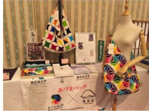
図2. 「かごんまの色」を使ったショルダーバッグ