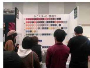
「かごんまの色総選挙」 (2019年2月)