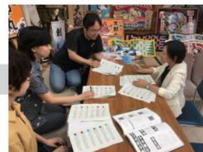
職人・デザイナーへのヒアリング (2019年5月～7月)