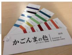
「かごんまの色」カラーガイド試作 (2019年4月)