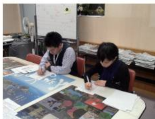
調査対象の選定 (2016年)