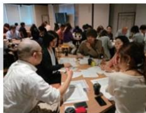
「かごんまの色60人会議」 (2019年4月)