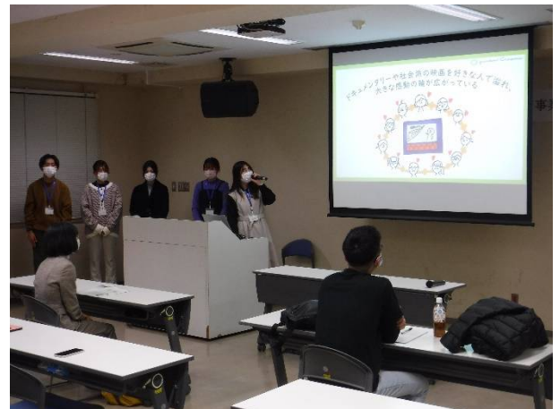
プレゼン（ガーデンズシネマ）