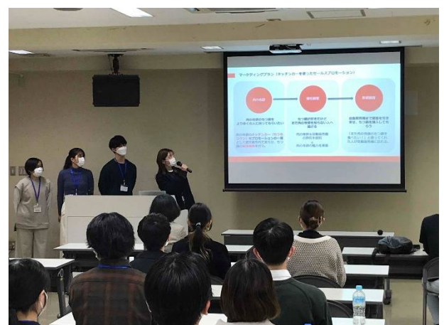
プレゼン（肉の寺師）