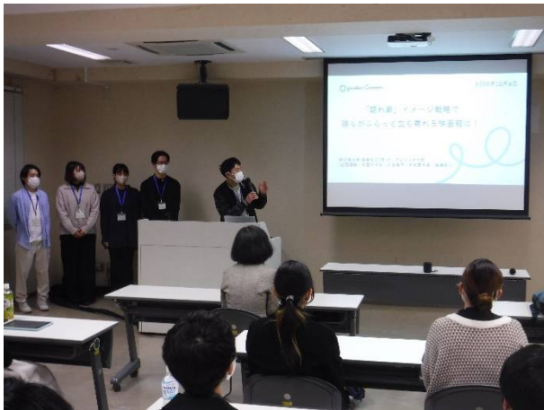
プレゼン（ガーデンズシネマ）