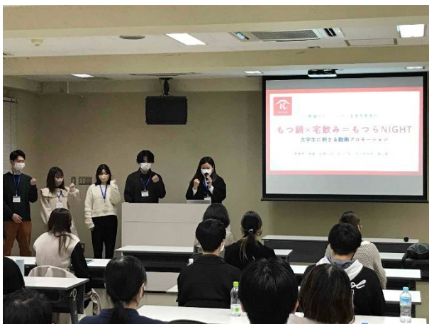
プレゼン（肉の寺師）