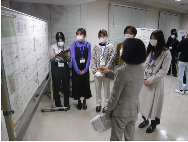
意見交換（ガーデンズシネマ）