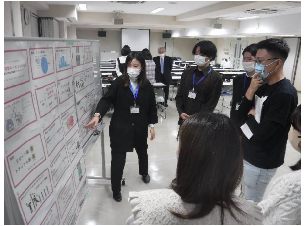
意見交換（肉の寺師）