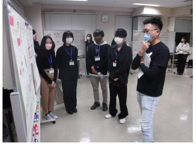
意見交換（肉の寺師）