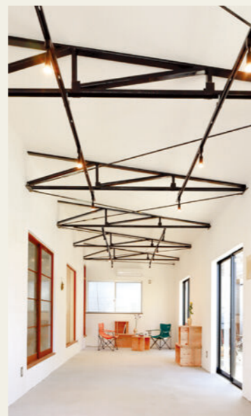
▲ よりどり (内観写真)

事業実施における大きな課題の一つである「お金」について学びます。資金計画の立て方や資金の調達方法について講師から学び、受講者自身の事業に落としこんでいきます。