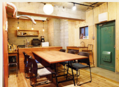
▲ 内菌ビル(内観写真)