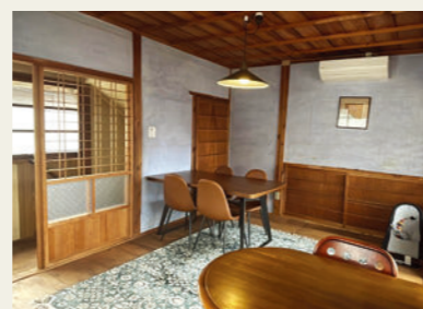
▲ otonari (内観写真)

先進地視察として、鹿児島市内のプロジェクトを見に行きます。リノベーション事業の波及効果について、実践者に直接お聞きします。事業の組み立て方や空間の使い方についても学びます。