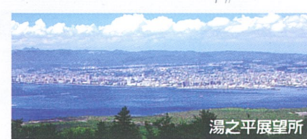
標高373mから市街地を一望する絶景スポット。 天気の良い日は遠く南に秀麗な開聞岳まで一望できる。夜は鹿児島市街地の夜景を楽しむことができる。展望所では桜島の歴史も紹介している。