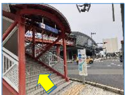
歩道橋を上がります。