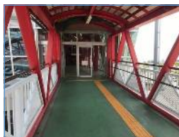
歩道橋を渡ります。 すぐに入り口があります。