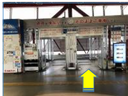
こちらからフェリーに乗船します。 ※料金は桜島港でのお支払いとなります。 そのまま乗船ください。