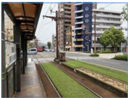
水族館口電停（鹿児島駅行）です。