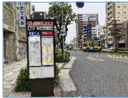
水族館口バス停からも同じ道順です。