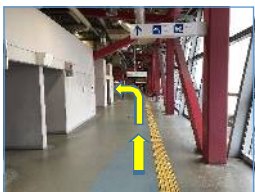
⑦から40mほど進んで左手側に乗船口があります。