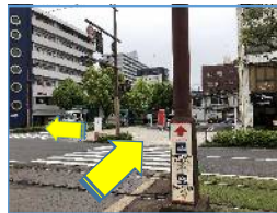
水族館方向へ進んで横断歩道を左に進みます。