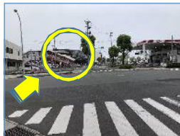
写真奥の歩道橋へ向かって直進します。