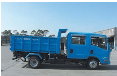
プレス車(ごみ収集車)