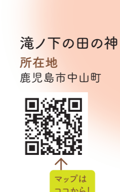
滝ノ下の田の神 所在地 鹿児島市中山町