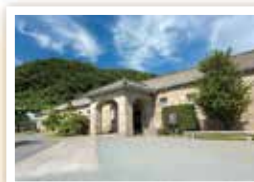
旧集成館機械工場(現・尚古集成館)

幕末から明治にかけての日本の近代化は、西洋以外の地域で初めて、また極めて短期間に急速な発展を遂げたという点で世界史的な価値があります。明治日本の産業革命遺産は、そのプロセスを証明する産業遺産群で九州・山口など8県11市の23資産で構成され、本市には3つの構成資産があります。