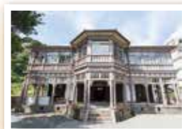
旧鹿児島紡績所技師館(異人館)