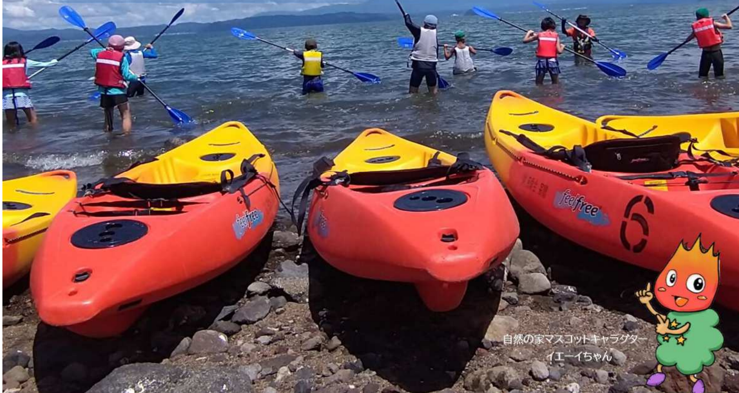
自然の家マスコットキャラクター イエーイちゃん