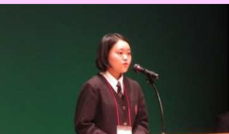
卒塾式(塾生代表あいさつ)