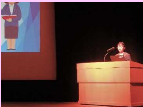
夢プログラム発表