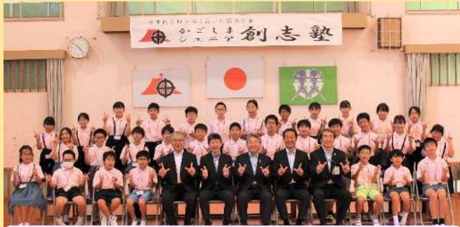
ジュニア創志塾 第6期生