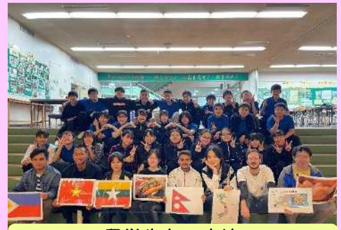
留学生との交流 九州日本語学校