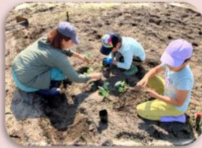
親子で育てようサツマイモ