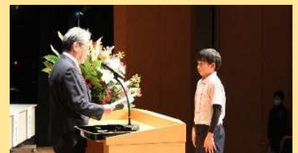
卒塾式(卒塾証書授与)