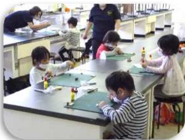
創作活動 (どんぐり人形)