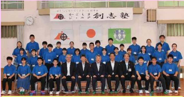
かごしま創志塾 第9期生