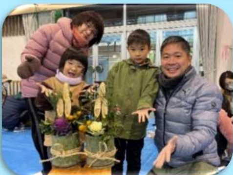
親子で作ろうミニ門松