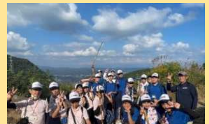
白銀坂ハイキング