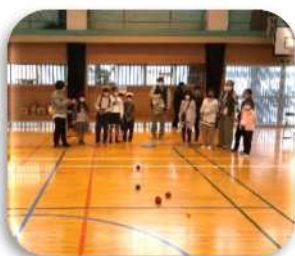
レクリエーション