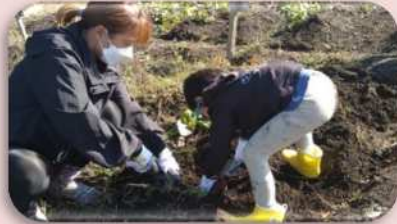
親子で育てよう冬野菜