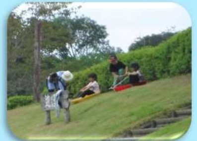
親子で遊ぼう（草そり）

親子でキャンプ活動を楽しむことができました。子供の普段にない表情を見ることができてよかったです。