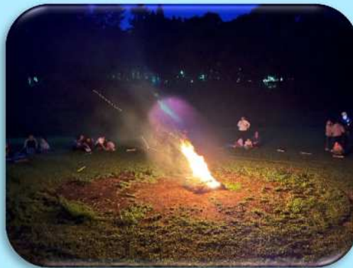
ボンファイヤー体験