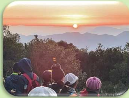
八重山日の出登山