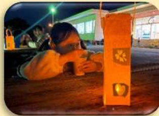
手作りランタンを灯しながら