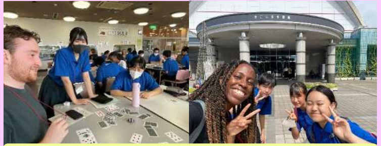
ALTプログラム 英語で観光案内