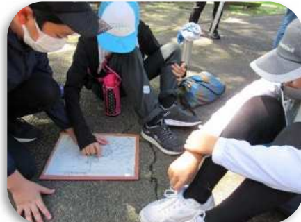
オリエンテーリング