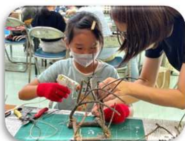
創作活動 (木の枝ランブシェード)

幼稚園や保育所の園外保育、お泊まり保育、一日遠足、親子交流などで利用できます。本物の自然体験を味わってみませんか。