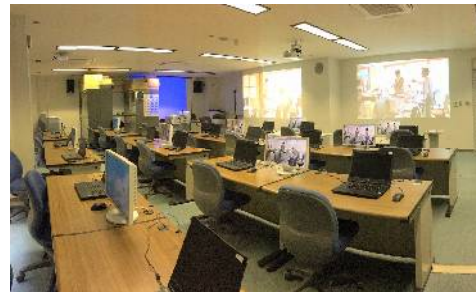
学習情報センター