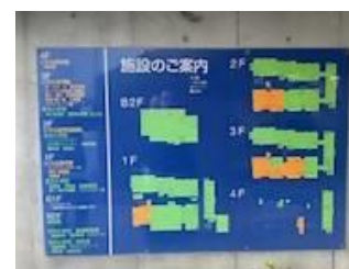
「公民館エリア」と「学校エリア」をわかりやすくするために色を分けされた掲示板