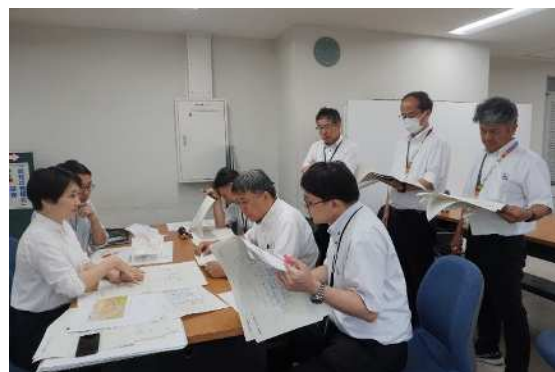
教職員に教室や特別教室の使い方をヒアリング(2023年8月1日)