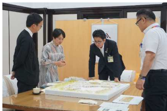
下鶴市長に設計の進捗報告(2023年6月26日)