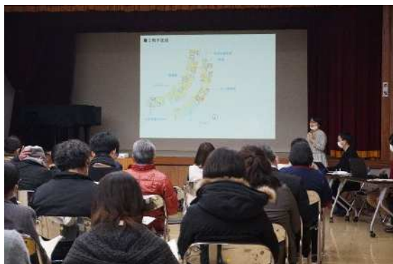
住民説明会 基本設計の経過説明(2023年2月16日)