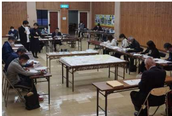
整備検討委員会 基本設計の最終案を説明(2023年3月23日)