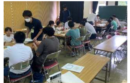
児童生徒の代表者によるワークショップ形式の意見交換会