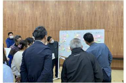
整備検討委員会での選定風景

教育委員会定例会での校名案議決と、市議会での鹿児島市立学校条例の一部改正議決を経て校名が「鹿児島市立 桜島学校」に決定しました。