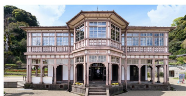
旧鹿児島紡績所技師館 (異人館)

イベント会場に専用駐車場はありません。公共交通機関でお越しください。 当日はマルシェ&ステージパフォーマンス、異人館内での機織り体験や鉄道に関するトークショーなどもあります。詳しくは右の二次元コードからHPへ。 (トークイベントについての問い合わせ先)