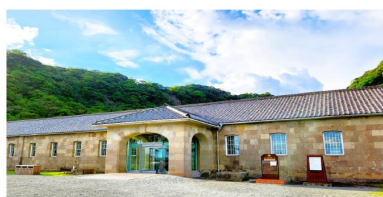
旧集成館機械工場 (現・尚古集成館)