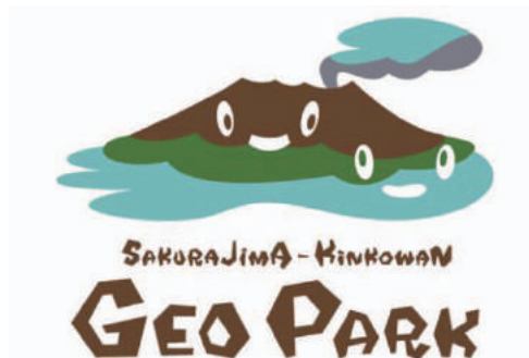
図 桜島・錦江湾ジオパーク ロゴ

これらを踏まえ、第3期鹿児島市観光未来戦略(平成29(2017)年3月策定)の重点施策にも掲げられているとおり、桜島火山そのものを活かした「桜島・錦江湾ジオパーク」、「錦江湾を生かした海の体験」、「まちなか温泉」や、桜島にちなんだ農林水産物も活かした「食の都 鹿児島づくり」、「グリーン・ツーリズム」等、多角的な視点で桜島の資源や恵みを活用し、交流人口の拡大と地域活性化に取り組んでいます。