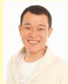
講演講師：千原せいじ 氏

（公財）鹿児島市中小企業勤労者福祉サービスセンターの会員事業所については、同センターで参加費を負担します。 よかセンター鹿児島（☎099-285-0003）へお問い合わせ下さい。