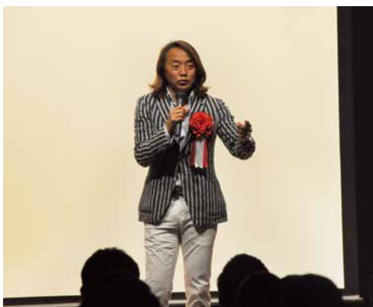
講話：北澤 豪 氏(サッカー元日本代表) 「熱き思いを大切に！」