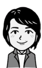
創企堂 新地 美沙 デザイン ブランディング POP