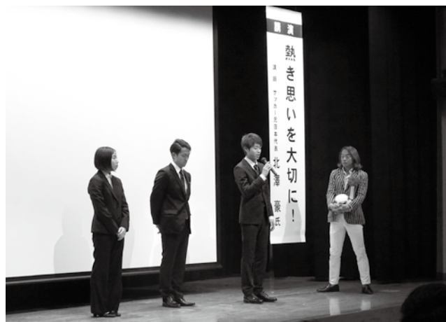
サッカー元日本代表 北澤 豪氏

参加者からは、「これから働いていく中での周囲の人との関わり方なども学ぶことが出来た。今回の講演の話のを忘れず、これから頑張っていきたい。」との声が聞かれました。