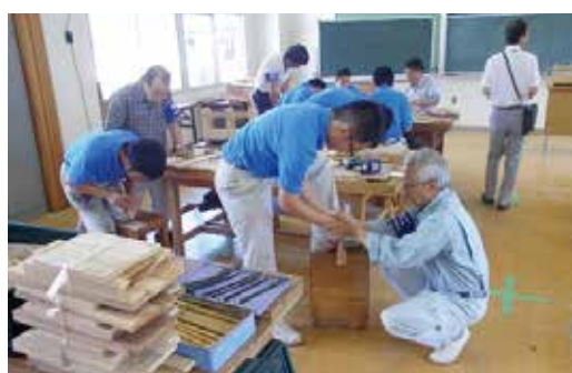
障害者技能体験教室(7月15日)