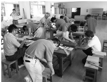
（鹿児島高等特別支援学校）