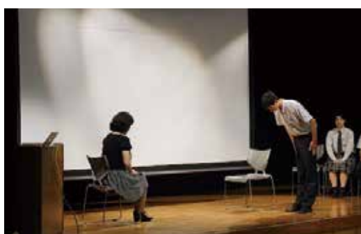
高校生ステップアップセミナー(7月4日～7日)