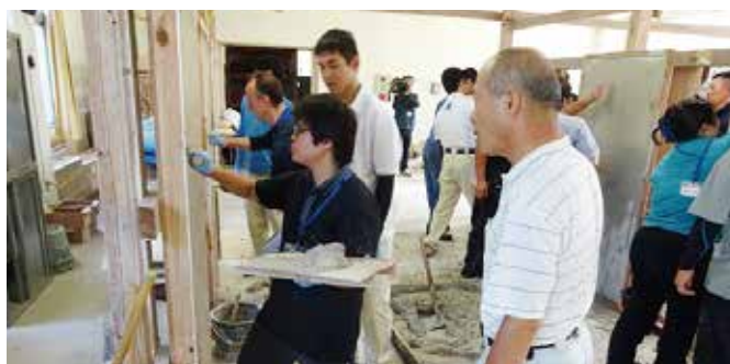
ものづくり 職人人材マッチング イベント (7月5日)