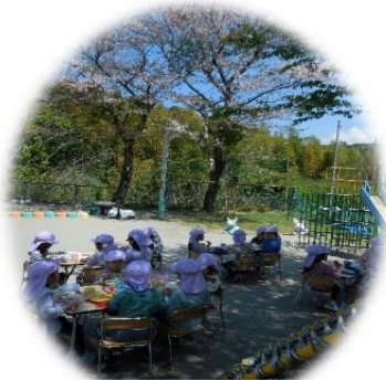
園庭でお花見給食