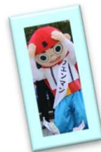
県庁かつおのぼり掲揚式