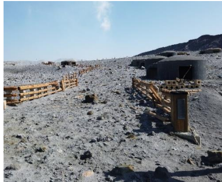
▲火山灰等に覆われた見学エリア