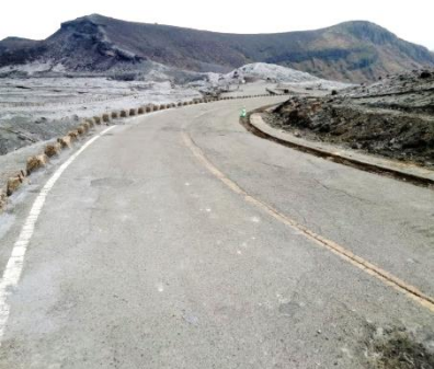
▲火山灰等を撤去した阿蘇山公園道路