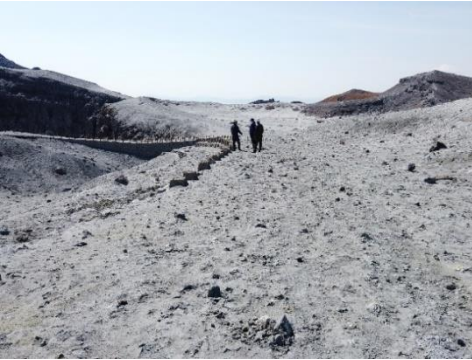
▲火山灰等に覆われた阿蘇山公園道路