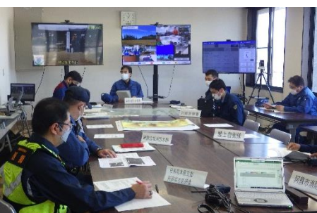
▲阿蘇市災害対策本部（阿蘇市役所内）

阿蘇山の「噴火警戒レベル4」を想定した熊本県・阿蘇市ほか2町村・救助機関などの参加による総合防災訓練を実施し、人命救助に重点をおいて対応能力の向上を図るとともに、訓練での課題や成果等の検証により、今後の火山防災計画等に活用することとしました。