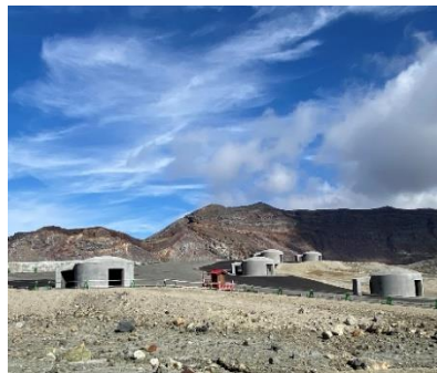
▲火山灰等を撤去した見学エリア