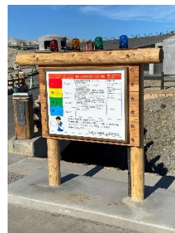
▲ガス検知器と連動した注意看板と整備中の2次避難施設