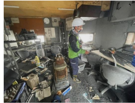
▲被害を受けた火口監視所