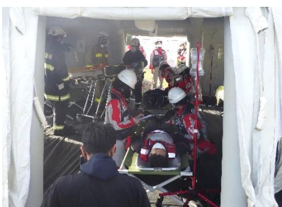
▲現地指揮本部に設置された救護所