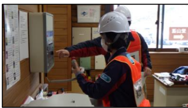
屋外スピーカーからの広報

市役所からのレベル2引き上げの情報により、観光施設職員による避難広報及び避難誘導等を、また登山客に対して消防防災ヘリによる上空からの避難広報を実施しました。