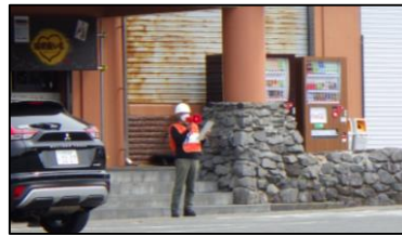
ハンドスピーカーからの広報