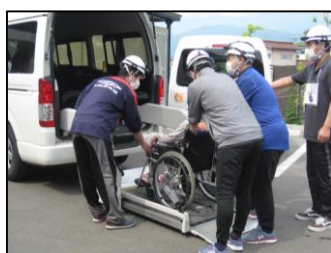
福祉施設の避難訓練

特に避難所においては「福島市防災士の会」が避難住民に対してパーティション設置などを指導していただき開設運営に協力していただきました。