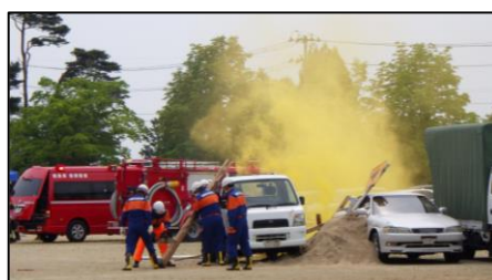
地元消防団による救出救助訓練