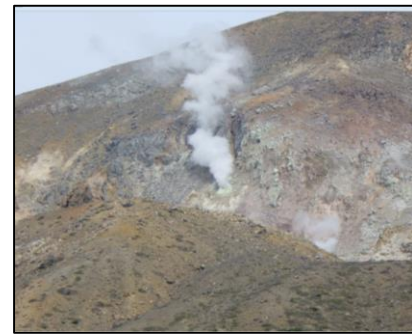
噴気活動が活発な大穴火口