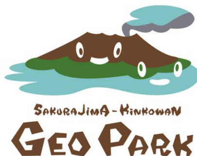
図 桜島・錦江湾ジオパーク ロゴ

これらを踏まえ、第 3 期鹿児島市観光未来戦略（平成 29（2017）年 3 月策定）の重点施策にも掲げられているとおり、桜島火山そのものを活かした「桜島・錦江湾ジオパーク」、「錦江湾を生かした海の体験」、「まちなか温泉」や、桜島にちなんだ農林水産物も活かした「食の都 鹿児島づくり」、「グリーン・ツーリズム」等、多角的な視点で桜島の資源や恵みを活用し、交流人口の拡大と地域活性化に取り組んでいます。