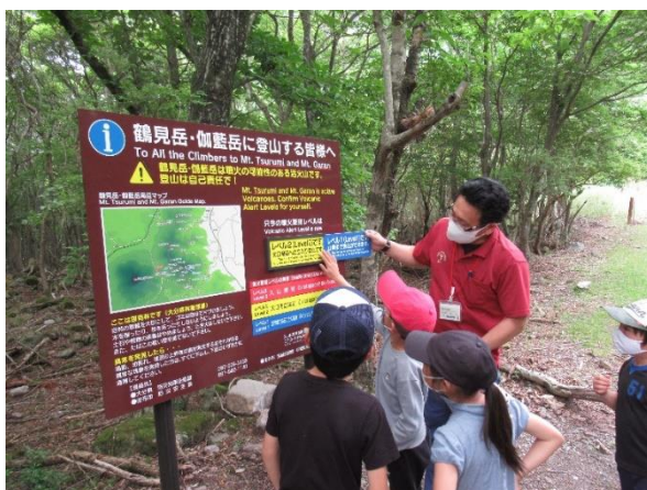
火山防災情報看板に興味津々の塚原小の児童たち