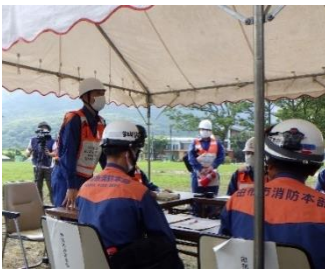
現地指揮所での情報収集