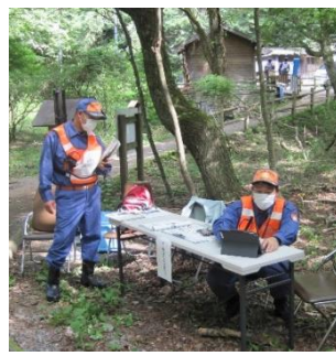
システムによる報告