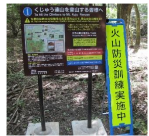
男池登山口に規制設置