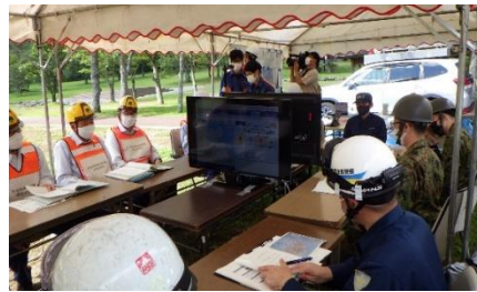
災害対応支援システムによる情報共有