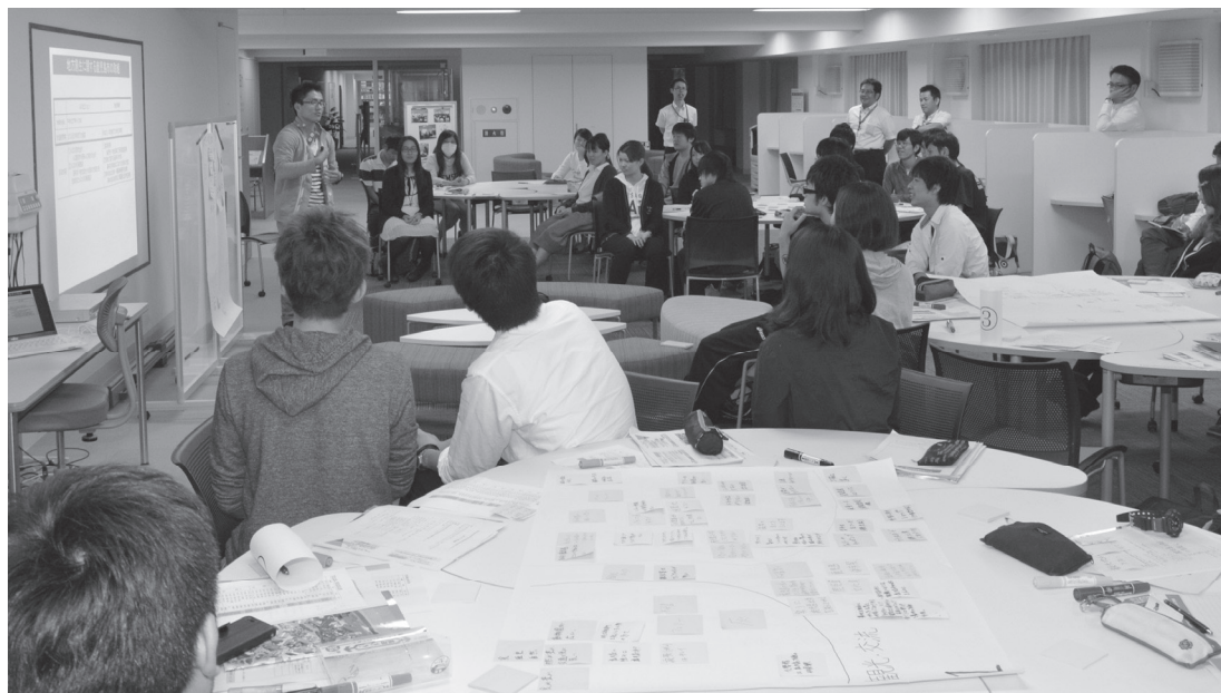
大学との連携（学生会議）