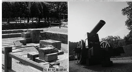
旧集成館の反射炉跡