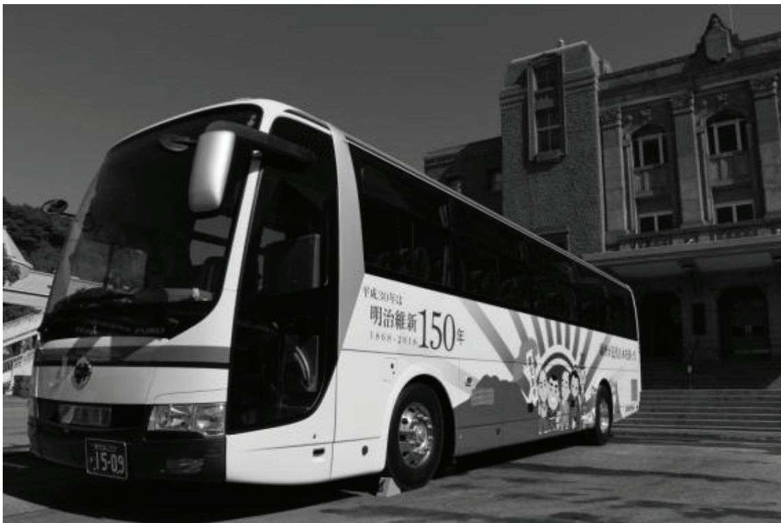
明治維新 150 年カウントダウン事業 P R ラッピングバス