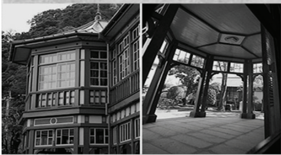
異人館（旧鹿児島紡績所技師館）