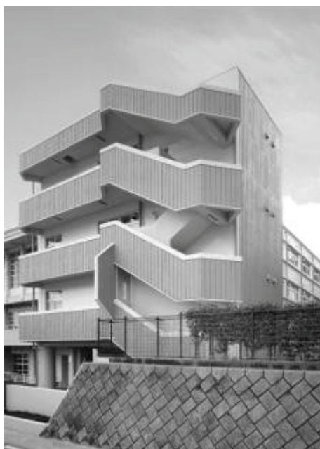
玉龍中学校特別教室棟