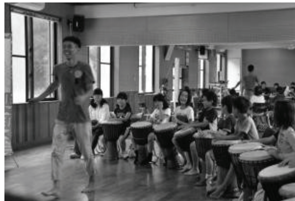
わくわくアドベンチャー事業 in 硫黄島