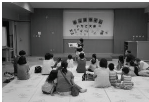
図書館読書イベント