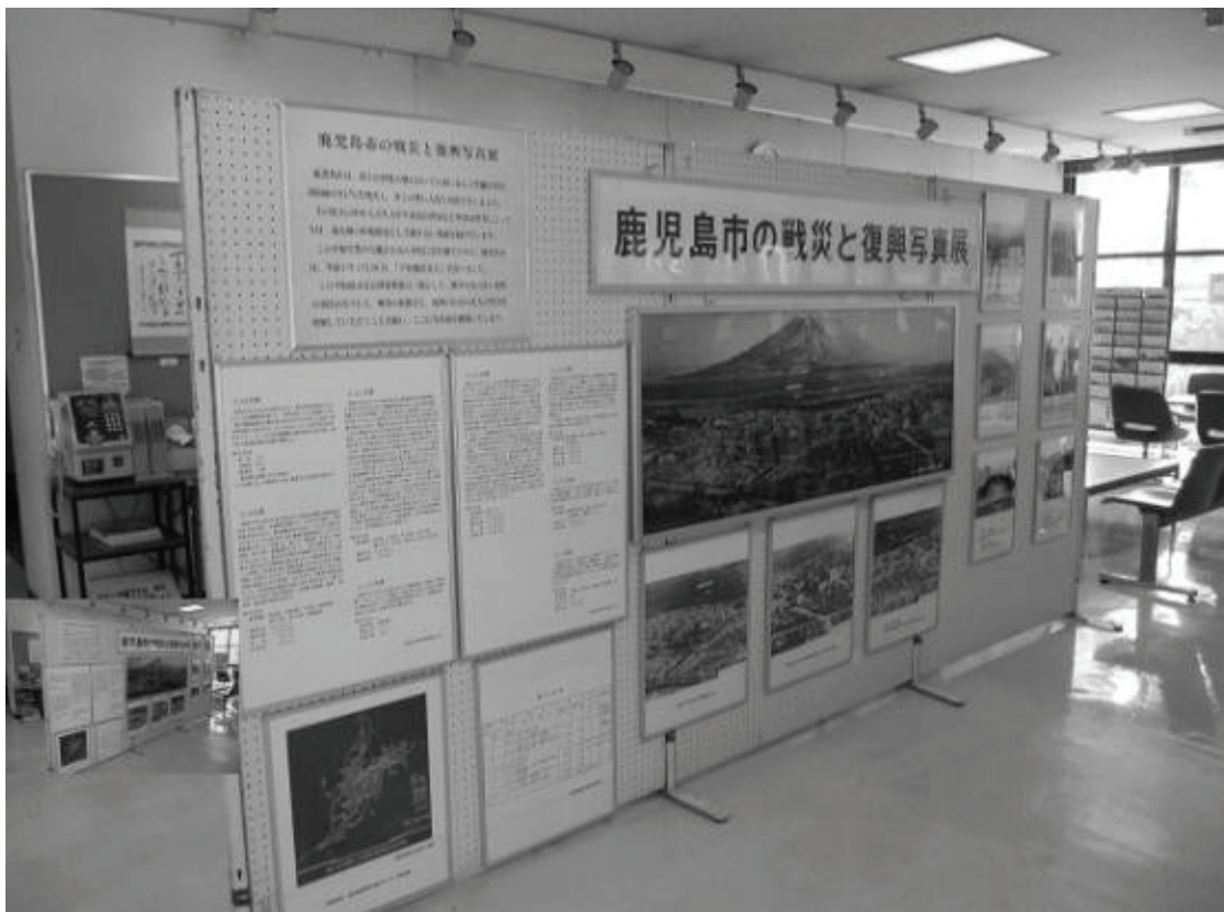
鹿児島市の戦災と復興写真展