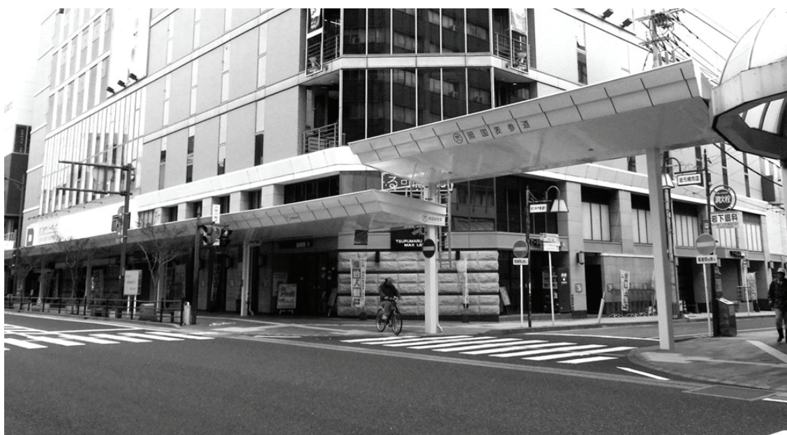
照国表参道アーケード