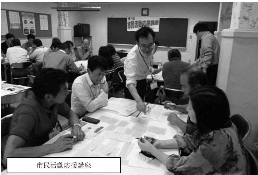
市民活動応援講座