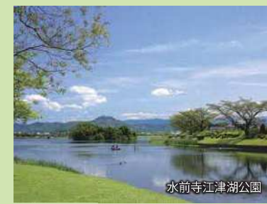
水前寺江津湖公園

日本三名城の一つに数えられる熊本城は、加藤清正が幾多の実戦経験を生かし、慶長4年(1599年)から築城を開始し同12年(1607年)に完成したとされています。復旧にはまだまだ期間を要しますが、2021年3月に完全復旧した天守閣では、リニューアルした展示と最上階からの眺めをお楽しみいただけます。