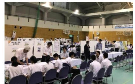
みらいワーク“かごしま”（30年度）