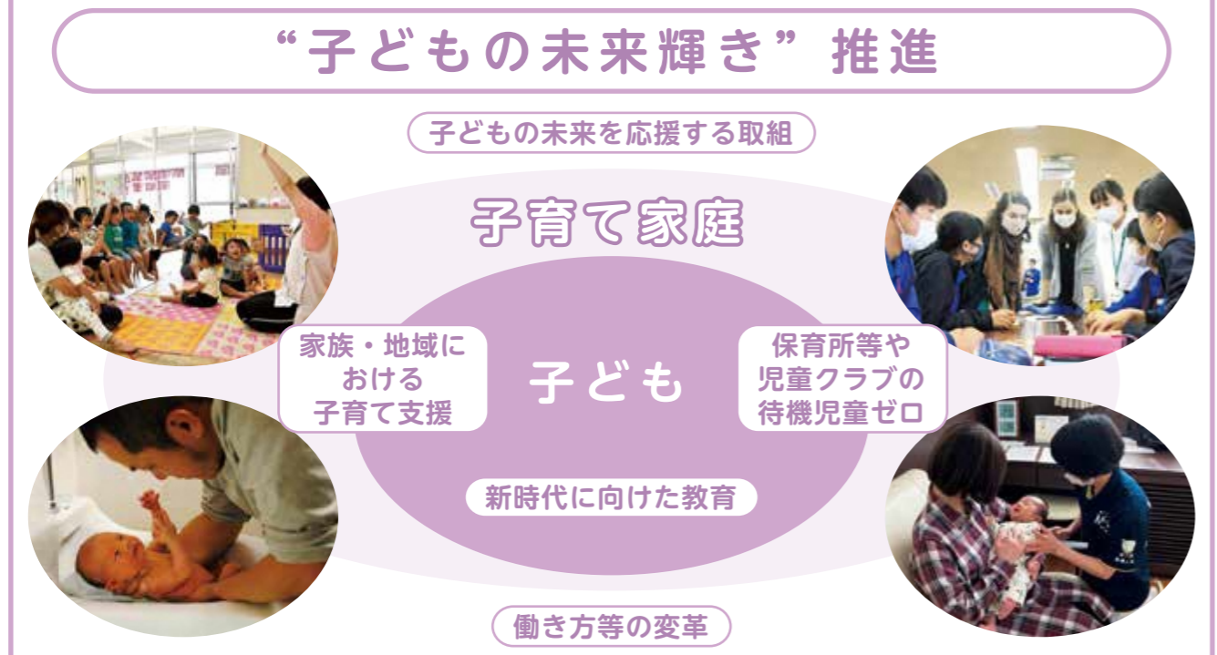
プロジェクトのイメージ図