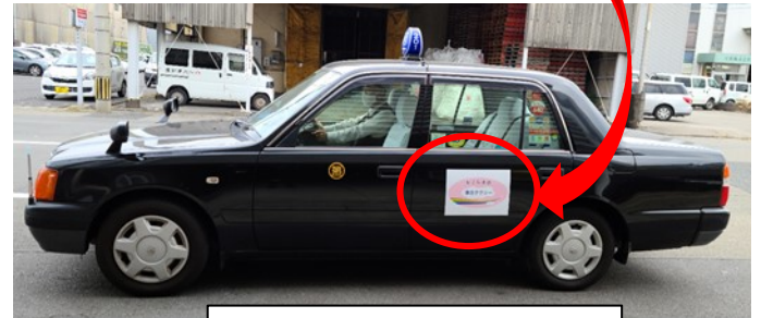
乗合タクシー用車両