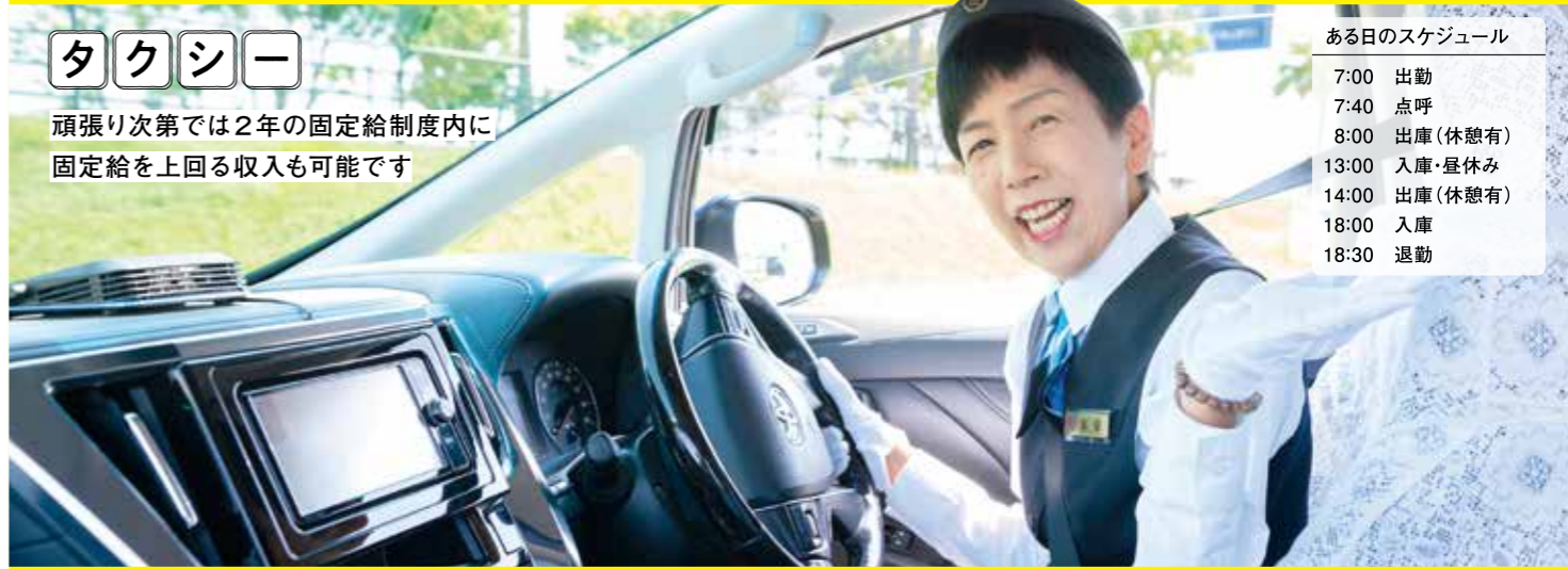
ある日のスケジュール