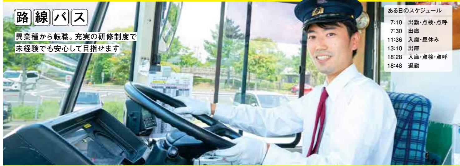
ある日のスケジュール