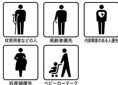
杖使用者などの人