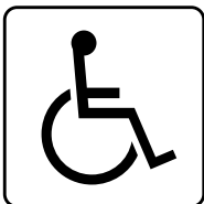
障害者のための 国際シンボルマーク