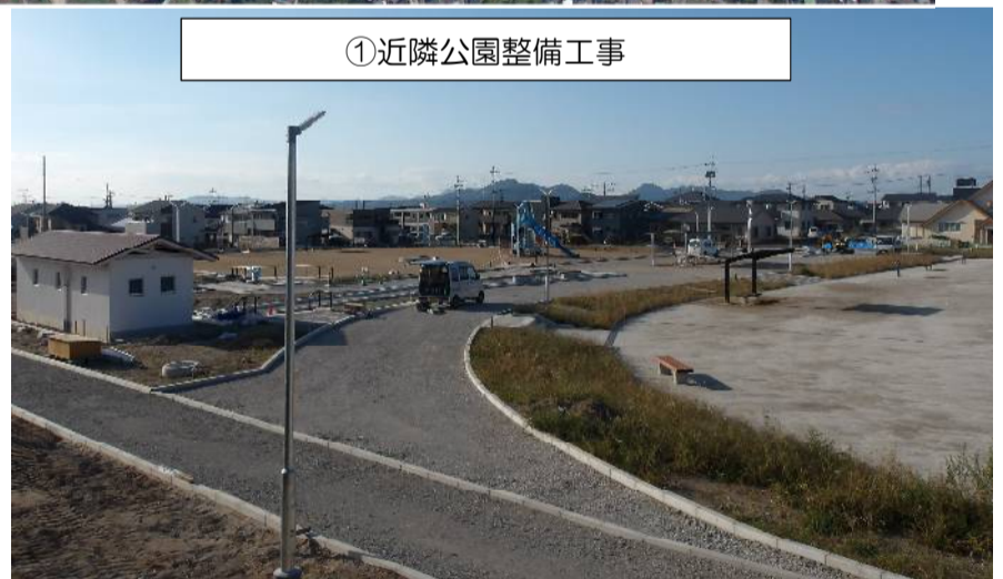
①近隣公園整備工事

皆様におかれましては、日頃より吉野地区土地区画整理事業の推進につきまして、ご理解、ご協力を賜り深く感謝申し上げます。