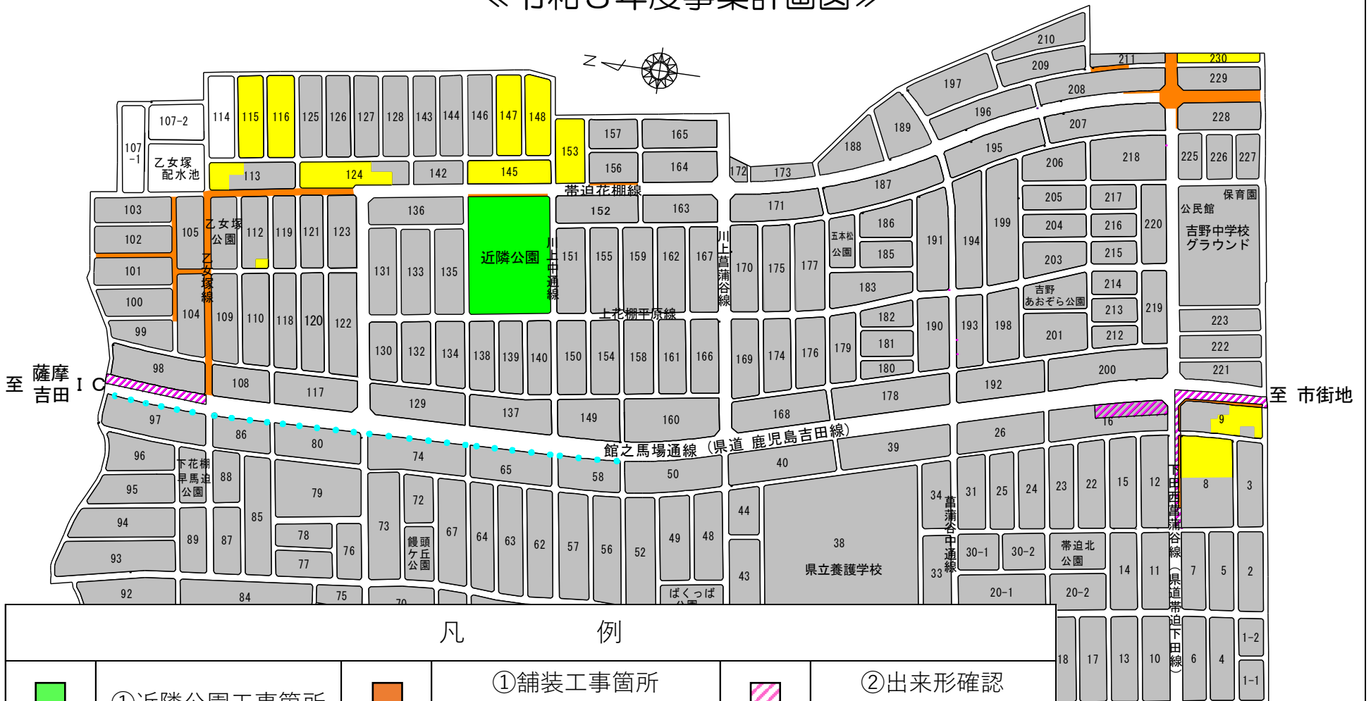
《令和3年度事業計画図》

皆様の安全や通行の規制に最大限配慮しながら、事業完了に向けて努力してまいりますので、何卒、ご理解、ご協力の程お願いいたします。