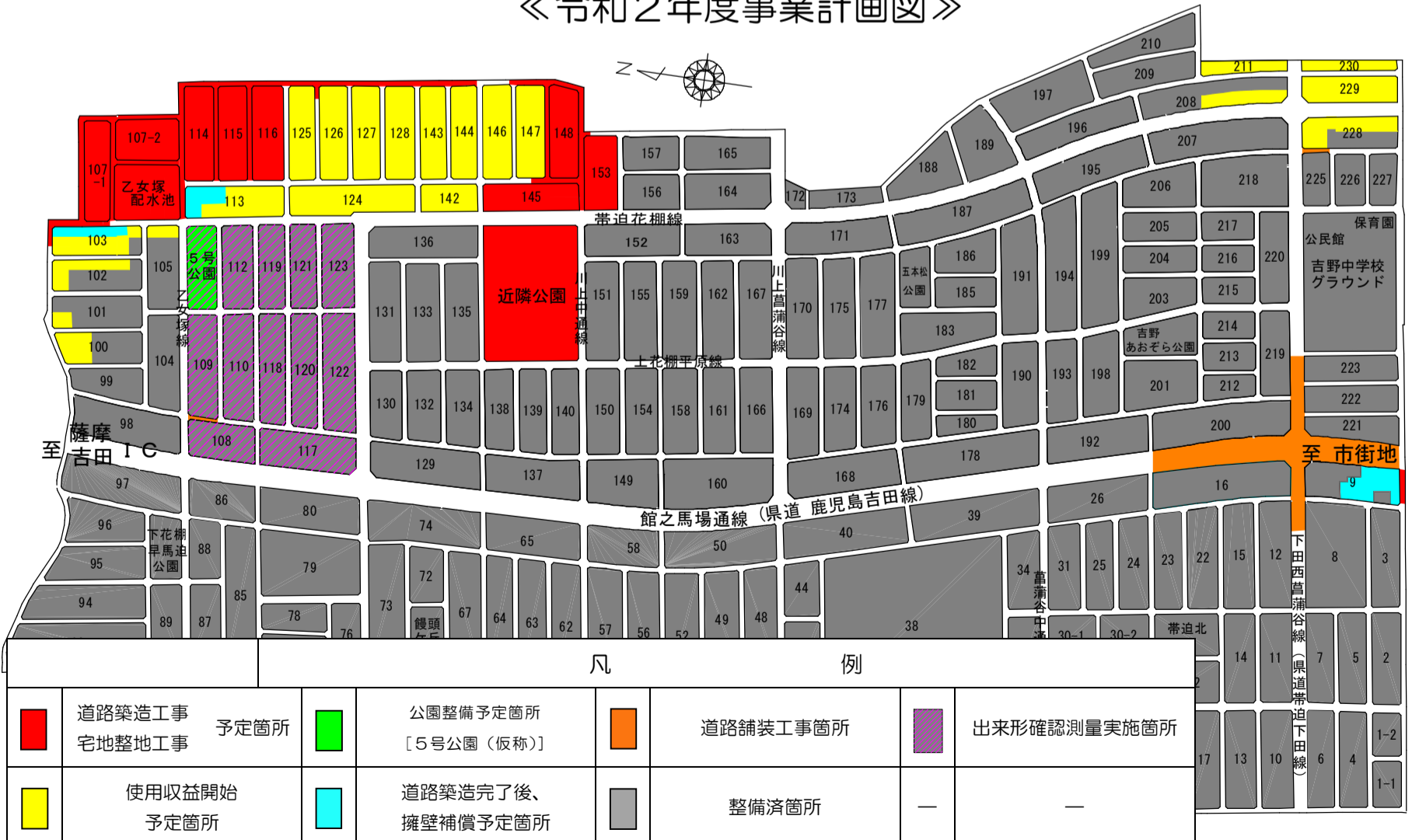
《令和2年度事業計画図》

道路工事や宅地整地工事、ライフライン整備工事等による迂回など、皆様には大変ご迷惑をおかけしております。皆様の安全や通行の規制に最大限配慮しながら、今年度の工事概成に向けて努力してまいりますので、何卒、ご理解、ご協力の程お願いいたします。