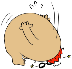
マグシティPRキャラクター 火山の妖精 マグニオン 「メガニオン」

今後、「区画整理だより」におき、個別協議の対象範囲などの状況をお知らせしてまいりますのでよろしくお願い申し上げます。