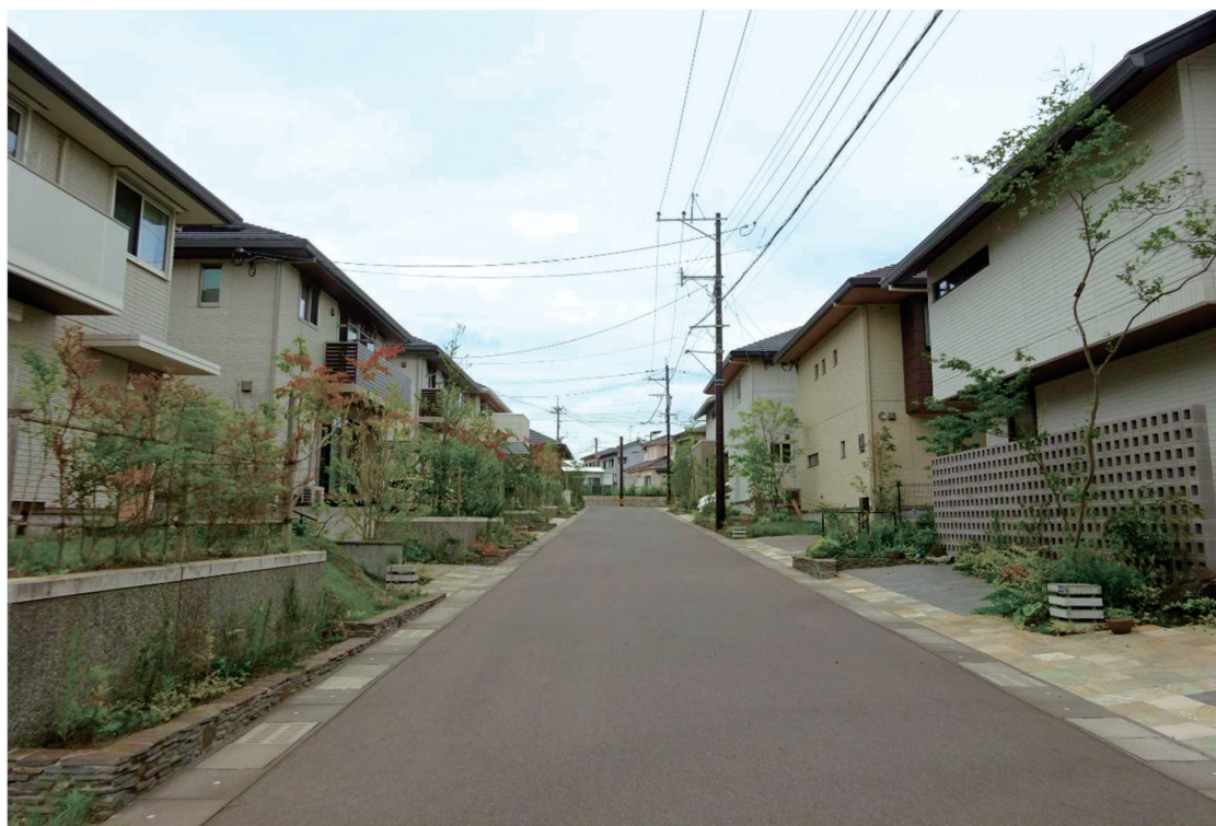
コモンヒルズ原良地区地区計画