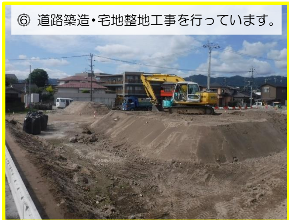
⑥ 道路築造・宅地整地工事を行っています。

向寒の候、皆様いかがお過ごしでしょうか。 日頃から谷山駅周辺地区土地区画整理事業につきましてご理解、ご協力を賜り、事業が推進できますことに深く感謝申し上げます。 上の写真は令和4年10月に撮影した谷山駅周辺地区の航空写真です。 36街区南側の一部の道路築造工事が完了しました。また、平成30年度から整備を進めてまいりました永田川沿いの区画道路擁壁築造工事については、今回の11と15工区の工事により、計画していたすべての区間の工事が完了しました。 現在、辻之堂本城線、南清見諏訪線の歩道舗装工事、2号公園・2街区の一部・24街区・31街区の一部・32街区の一部・35街区の一部・36街区の一部の宅地整地工事や周辺の道路築造工事、南清見諏訪線の道路照明設備工事を進めています。 今後も皆様の仮換地をできるだけ早くお返しできるよう努力してまいりますので、引き続きご協力をよろしくお願いいたします。