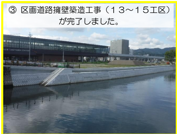
③ 区画道路擁壁築造工事(13~15工区)が完了しました。