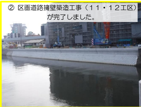
② 区画道路擁壁築造工事(11・12工区)が完了しました。