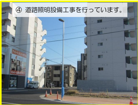
④ 道路照明設備工事を行っています。