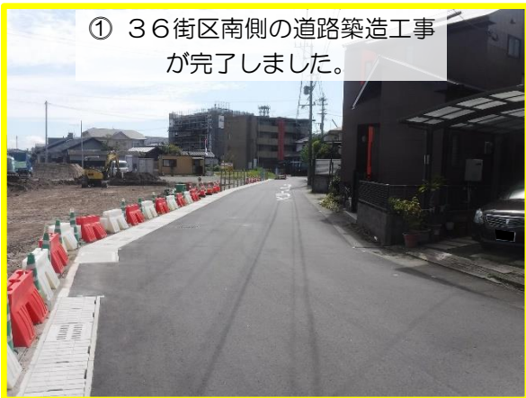
① 36街区南側の道路築造工事が完了しました。