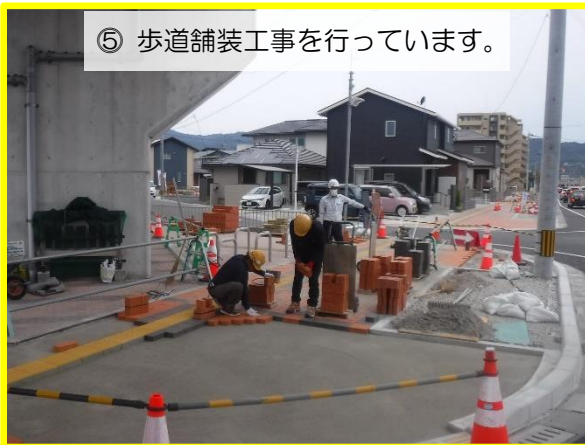
⑤ 歩道舗装工事を行っています。