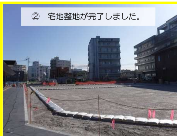
② 宅地整地が完了しました。