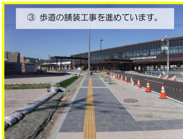
③ 歩道の舗装工事を進めています。