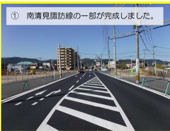
① 南清見諏訪線の一部が完成しました。