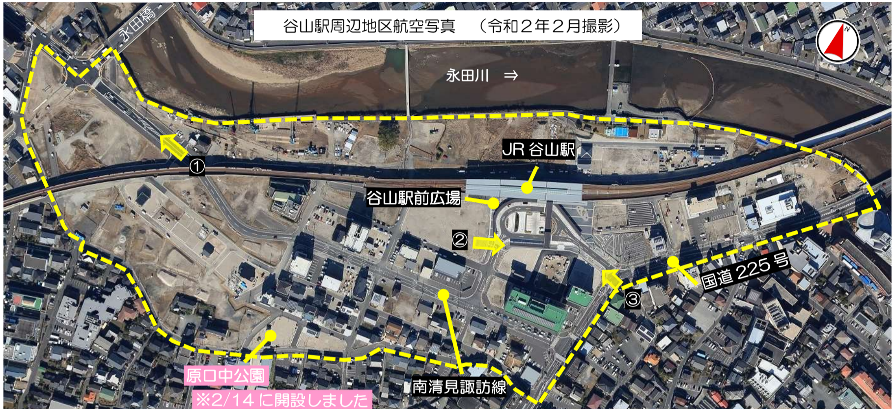
谷山駅周辺地区航空写真 (令和2年2月撮影)

連絡先 谷山駅周辺地区係 Tel.099-269-8435 (直通) 補償係 Tel.099-269-8437 (直通) 工事係 Tel.099-269-2141 (直通) 谷山第二・第三地区係 Tel.099-269-8436 (直通) F A X 099-268-2602