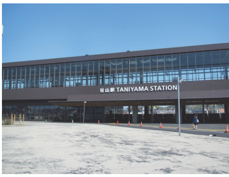
谷山駅の新駅舎が完成しました。