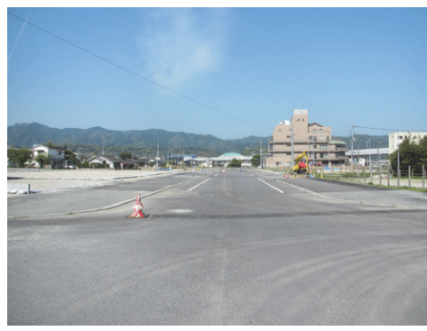
南清見諏訪線などの工事を進めています。