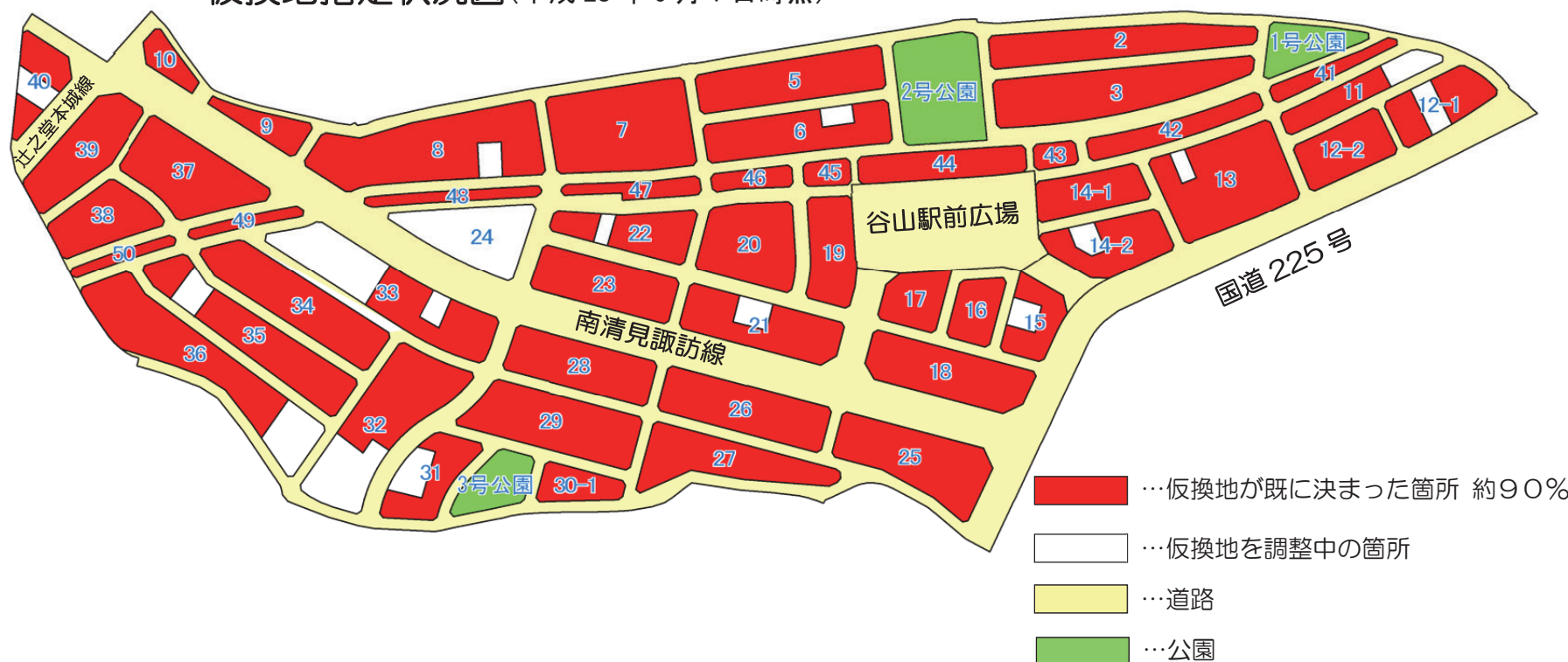
仮換地指定状況図(平成28年6月1日時点)