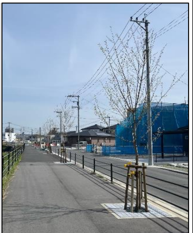
③ 街路樹植栽工事を行いました。