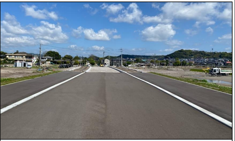
① 幹線道路築造の工事を進めています。