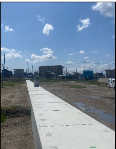
② 水路整備の工事を進めています。